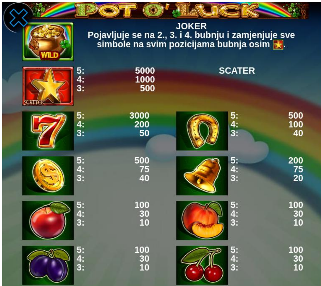
2. slika Tablica isplata