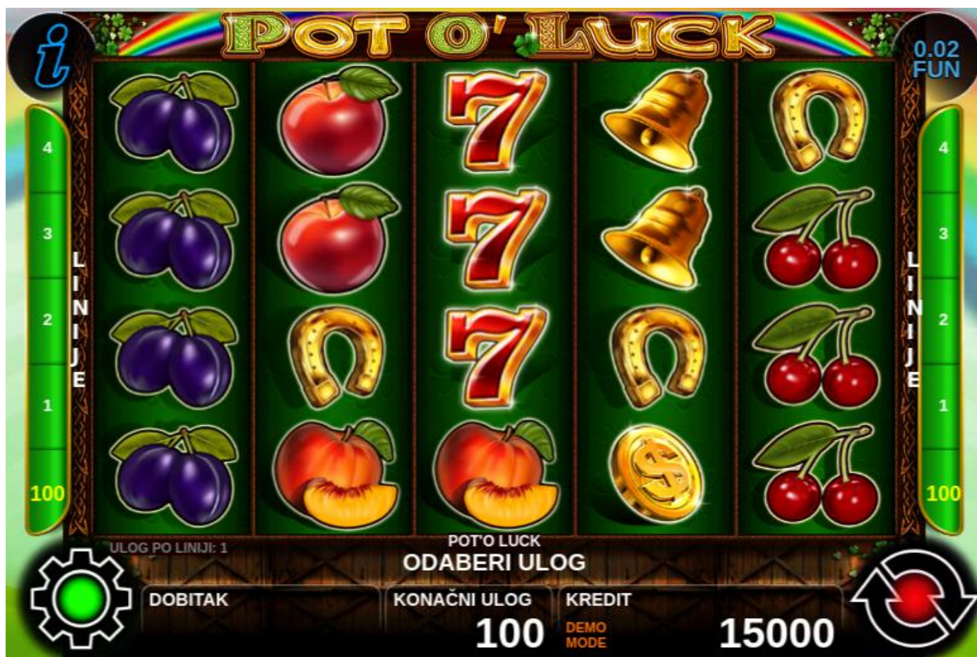
1. slika Glavni zaslon igre